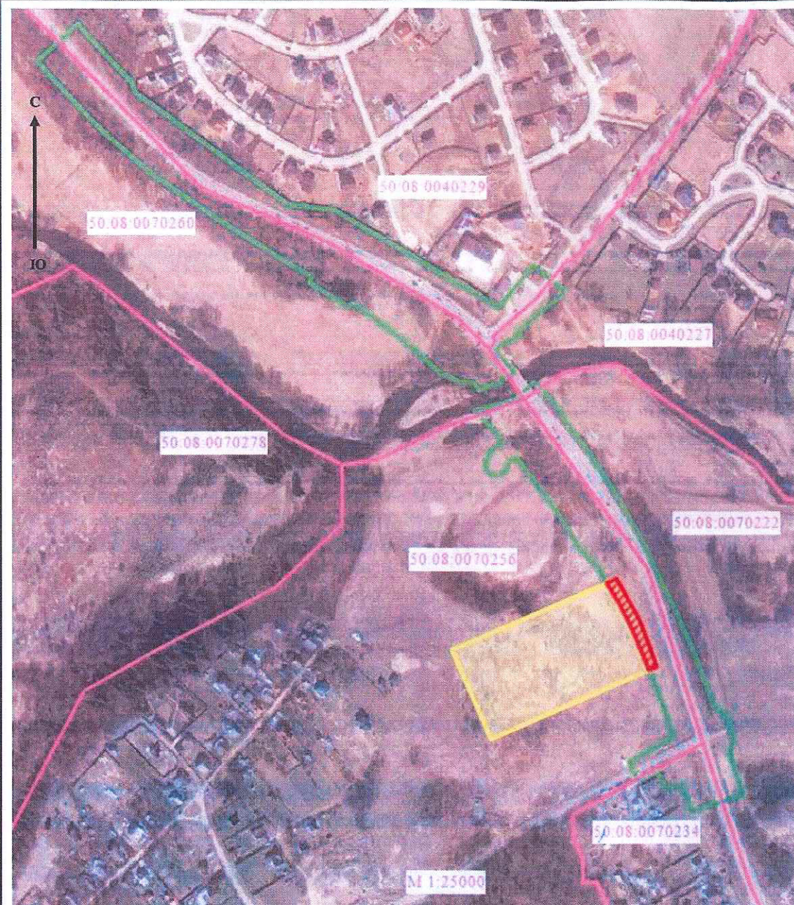
Каталог координат (МСК-50, зона 1)